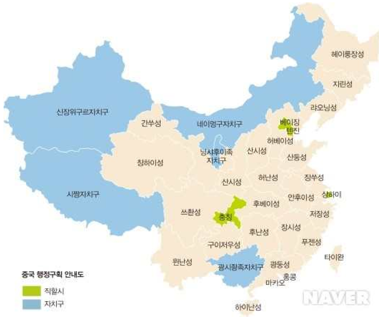
중국 행정구획 안내도