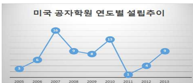
<표 1> 미국 공자학원 연도별 설립추이 23)

아래 <표 1>에서 나타나듯 미국의 공자학원의 설립은 꾸준히 이루어졌고 2007년과 2010년에 많이 설립되었으며 2011년과 2012년에는 설립의 수가 축소된 것을 알 수 있다.